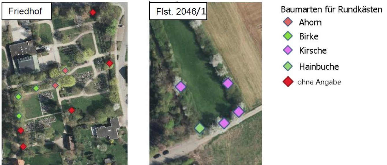
Abb. 3: Standorte für die Anbringung von 10 Rundkästen für Fledermäuse auf dem Friedhof von Rommelsbach (links) sowie 5 auf dem Flurstück 2046/1 im Südosten von Rommelsbach (rechts)