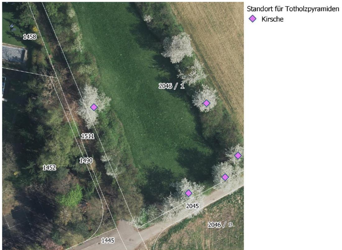
Abb1: Standorte für die Anbringung der Totholzstämme auf dem Flst. 2046/1 im Südosten von Rommelsbach