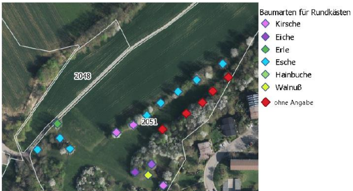
Abb. 4: Standorte für die Anbringung von 20 Rundkästen für Fledermäuse auf dem Flurstück 2051 im Südosten von Rommelsbach

Darüber hinaus ist im Bebauungsplan auch geregelt, dass eine Gehölzfällung ausschließlich zwischen November und Ende Februar bei Frosttemperaturen zulässig ist, alternativ können die Fällungen auch nach einer vorherigen Inspektion durch einen Fledermausspezialisten zwischen 1. Oktober und 28./29. Februar durchgeführt werden. Auch für Gebäudeabbrüche bzw. -sanierungen gilt, dass eine vorherige Inspektion (z.B. von Dachstuhl oder Keller und Fassade) durch Artenschutzexperten erforderlich ist, um auszuschließen, dass bei dem nachfolgenden Abbruch oder der Sanierung gegen die Regelungen des § 44 BNatSchG verstoßen wird.