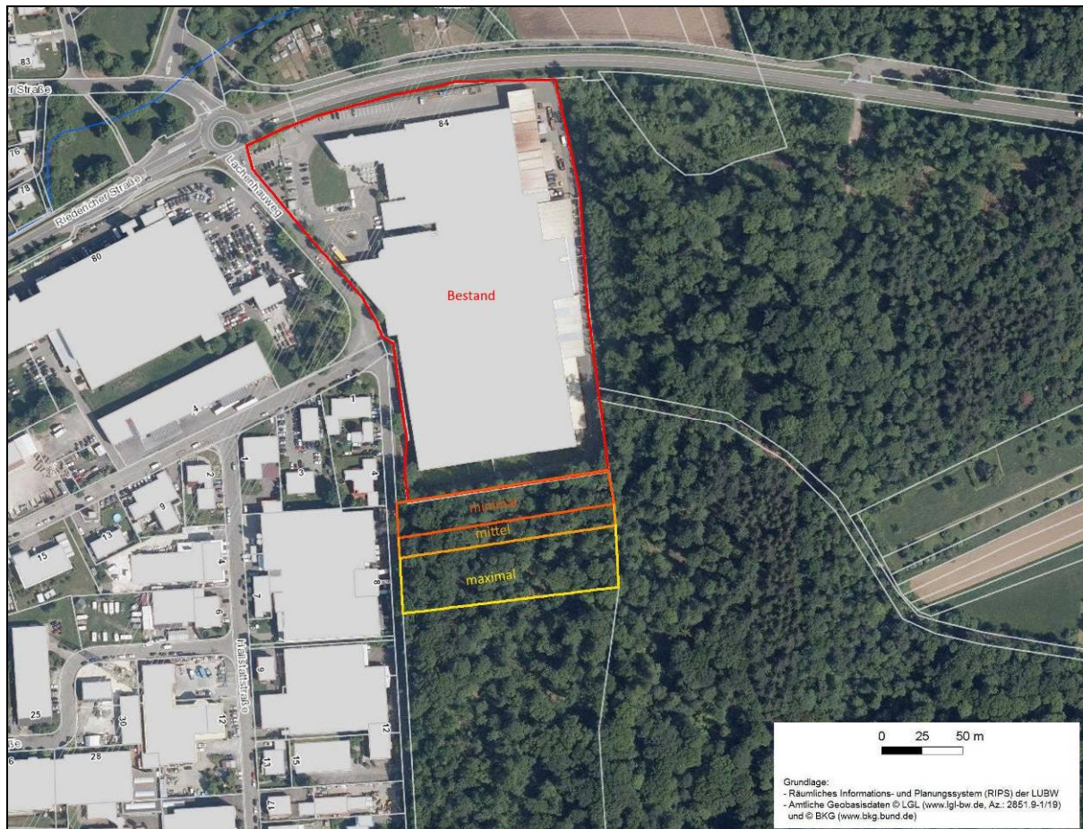
Abbildung 1 Darstellung der Planvarianten im Luftbild. Die farblich abgesetzten Erweiterungsvarianten beziehen sich auch die jeweilige Waldverlustfläche. Luftbild LUBW Daten- und Kartendienst.

Der betroffene Waldbereich ist ein Laubmischwald. Es dominieren Rotbuchen und Eichen, daneben kommen aber auch Kirschbäume und Bergahorn vor. Die Stammdurchmesser betragen bei den Eichen bis 100 cm, bei den Rotbuchen bis 60 cm und bei Bergahorn und Kirsch bis 50 cm. Die Strauchschicht ist insgesamt lückig, aber vorhanden. Im Mittelteil direkt südlich des Firmengeländes ist ein Bereich mit Lichtungscharakter vorhanden, hier dominieren mehrere Haselbüsche. In den letzten Jahren wurden dem Wald vermutlich vereinzelt größere Eschen entnommen, es sind entsprechende Stümpfe vorhanden.