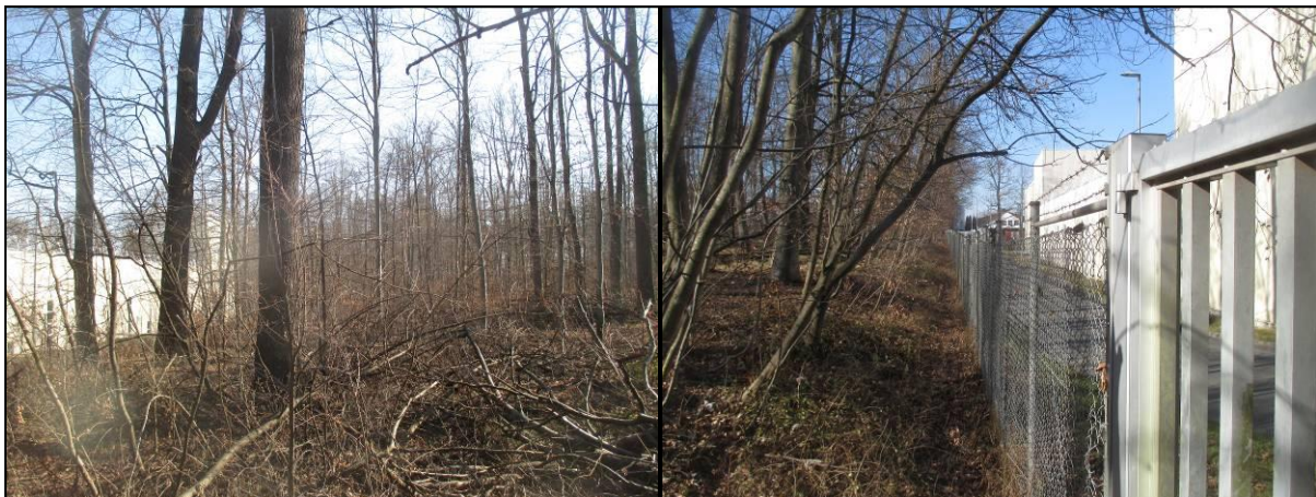
Abbildung 2 Betroffener Waldbereich, Ansicht von West (links) und von Ost (rechts).

Im betroffenen Waldbereich ist Lebensraumeignung für europäische Vogelarten vorhanden, darunter auch die gefährdete Art Pirol ( Oriolus oriolus ) sowie die stark gefährdeten Arten Grauspecht ( Picus canus ) und Waldlaubsänger ( Phylloscopus sibilatrix ). Es sind Gehölzfreibrüter und Baumhöhlenbrüter zu erwarten. Für Fledermäuse ist der Waldbereich als Nahrungsgebiet geeignet, außerdem sind Quartiere im Baumbestand nicht auszuschließen. Weiterhin sind Vorkommen geschützter Holz bewohnender Käferarten möglich, insbesondere des Hirschkäfers ( Lucanus cervus ). Der Waldbereich ist darüber hinaus auch für die streng geschützte Haselmaus ( Muscardinus avellanarius ) als Lebensraum geeignet.