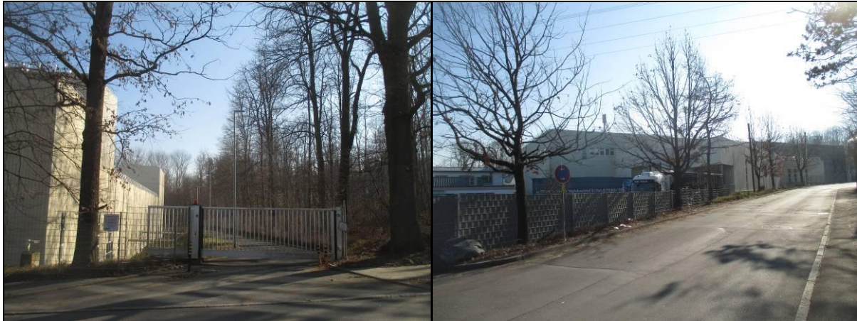
Abbildung 3 Südende: Einfahrt Rettungsweg Feuerwehr (links), rechts Ansicht des Firmengeländes von Nordwesten vom Lachenhauweg aus.