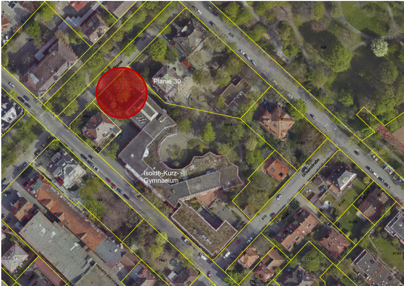
Auszug Stadtplan Stadt Reutlingen mit Darstellung Grundstücksgrenzen

Im Zuge der Studie wurde seitens des Architekturbüros Dannien Roller die Erweiterung im westlichen Teil des Gebäudes untersucht (ergänzende Angaben siehe Anlage 1). Dies ist nach Ergebnis vom 26.07.2019 grundsätzlich möglich.