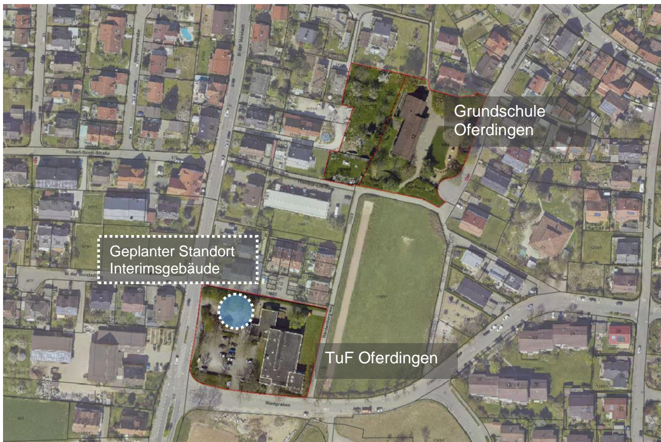
Auszug aus Stadtplan Stadt Reutlingen mit Darstellung Grundstücksgrenzen